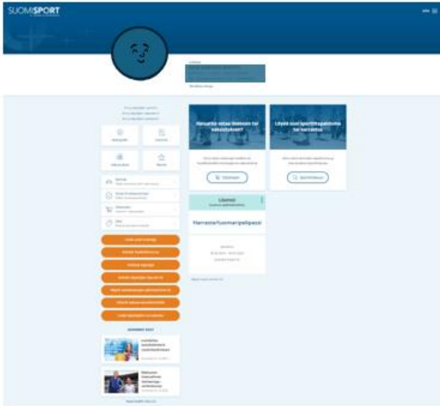
Kuva 2. Sporttitilin selainnäkömä (Sporttitilistä on myös mobiilinäkymä Suomisport-aplikaatiossa (iOS ja Android))

Sporttitililtä on pääsy niiden organisaatioiden (lajiliitto, urheiluseura, Olympiakomitea) palveluihin ja toimintoihin, joihin tilinhaltijalle on myönnetty käyttöoikeus. Lisäksi siellä voi luoda Sporttitilin huolettavalleen, hallinnoida hänen tietojaan ja hankkia urheiluyhteisön tarjoamia tuotteita. Ostotoiminnon lisäksi tilillä on kalenteri-, viestit- ja maksut -toiminnot, ja sieltä pääsy kolmansien osapuolten tarjoamiin etuihin (Uusimmat edut-palvelu). Sporttitilin luominen ja Suomisport-aplikaation lataaminen ei edellytä ostojen suorittamista palvelussa. Parhaan käsityksen liikkujapalvelun toiminnasta saa kirjautumalla palveluun, luomalla oma Sporttitili ja tutustumalla Sporttitilin kautta palvelun liikkujille suunnattuihin toimintoihin ja ominaisuuksiin.