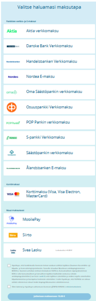
Kuva 7. Maksutapavalinta

Suomisport-palvelun maksupalvelusta vastaa Svea Payments Oy. Maksupalvelun on sulautettu liikkujan ostopolkuun, jossa tarjolla on laaja valikoima yleisiä maksutapoja (ks. Kuva 7).